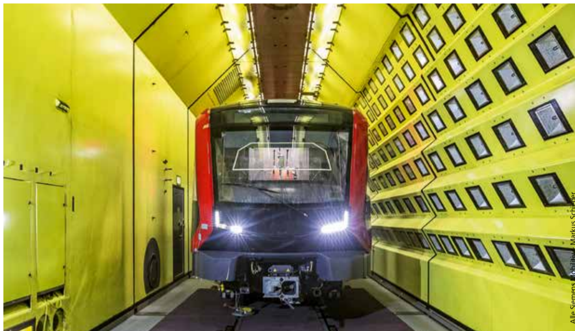
Der G1 im längsten Klima-Wind-Kanal der Welt. Er muss zeigen, dass er bei Eis und Hitze zuverlässig ist.