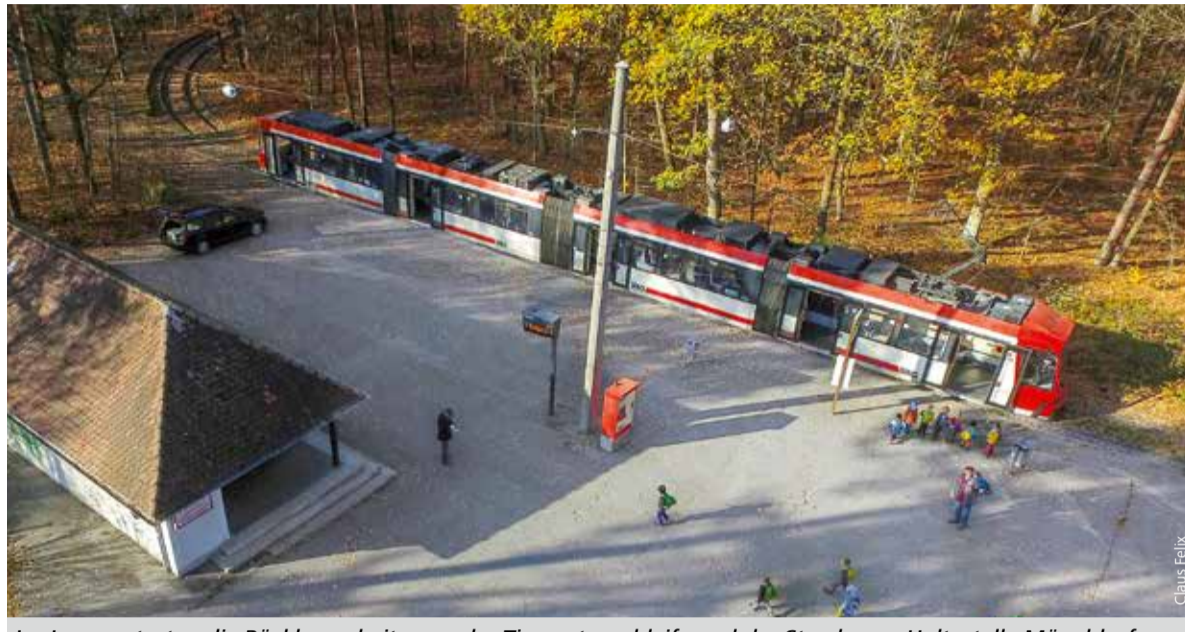
Im Januar starten die Rückbauarbeiten an der Tiergartenschleife und der Strecke zur Haltestelle Mögeldorf.

Nach dem Rückbau der Fahrleitung und der Gleisanlage in der Wendeschleife wird die N-ERGIE dort eine für das Nürnberger Stadtgebiet sehr wichtige Trinkwasserleitung erneuern, die vom Hochbehälter Schmausenbuck kommend unter der Schlei-