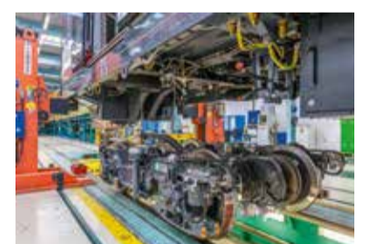
Wagenkasten trifft Fahrwerk.

zentrieren sich nun auf die Fahrgasträume und den Fahrerstand, auf Türen und Luftverteilungs-system. Im Passagierbereich werden die Sitzgarnituren und die Haltestangen montiert. Trennwände und Verkleidungselemente an den Seitenwänden werden eingebaut.