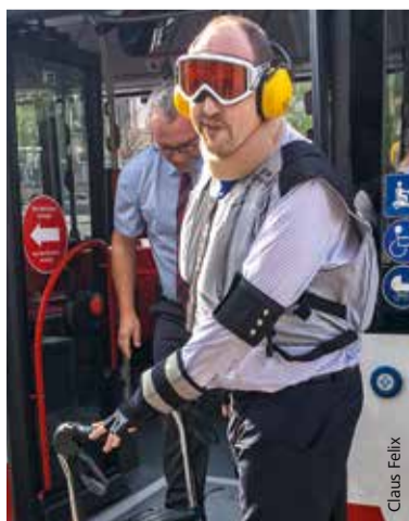
Der Anzug zeigt, was uns erwartet.

Im ersten Schritt konnte Sör so den Umbau von zehn Haltestellen angehen, weitere werden folgen. ■