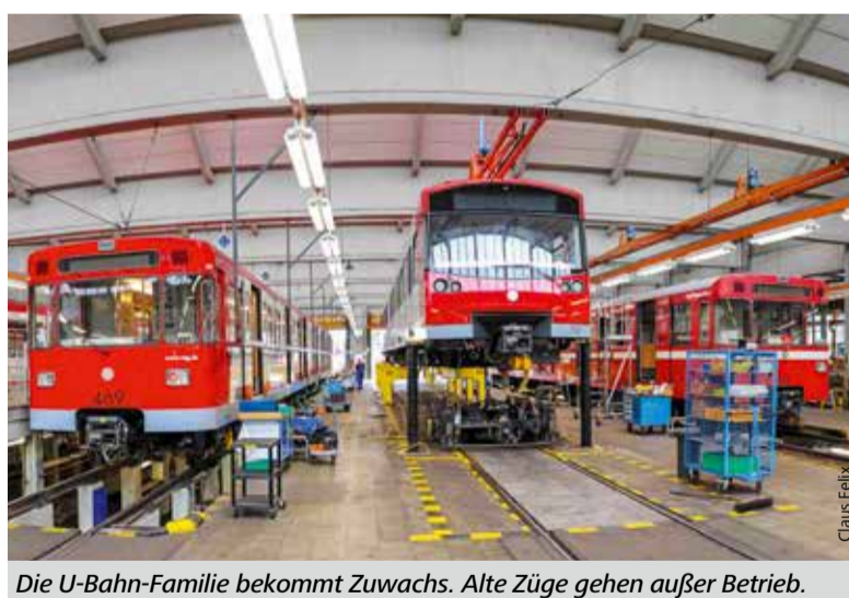
Die U-Bahn-Familie bekommt Zuwachs. Alte Züge gehen außer Betrieb.

Seit 2008 fahren in Nürnberg auch automatische Züge der Baureihe DT3. Um die ältesten DT1 ausmustern zu können und die Wagenreserve niedrig zu halten, beschaffte die VAG 2010/2011 Fahrzeuge, die im voll automatisierten Betrieb wie im konventionellen mit Fahrern eingesetzt werden können. Diese DT3-F – F für Fahrerstand – werden, wenn alle neuen Gliederzüge ausgeliefert sind, nur noch auf der U2 (Röthenbach-Flughafen) und U3 (Gustav-Adolf-Straße-Nordwestring)