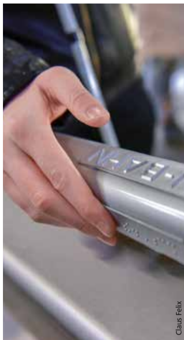
Taktile Beschriftung informiert.

Er entscheidet sich für den Weg zur U-Bahn. Der ist wichtig für ihn, wenn er am Wochenende mit dem Zug zu seiner Familie nach München fährt. Der 23-Jährige sieht von Geburt an nur auf dem linken Auge und nur in der Nähe. Doch seine gute Stocktechnik lässt ihn den Abgang zur U-Bahn souverän meis-