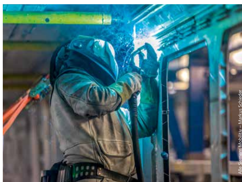
Im Rohbau: manuelles Schweißen, wo der Schweißroboter unterlegen ist.

Der Fertigungsprozess im Rohbau reicht von Einzelteilen und Baugruppen bis hin zum Zusammenbau des Wagenkastens. Modernste Fertigungstechnologien, wie etwa der Einsatz von Schweißrobotern oder Anlagen für das Fräsen ganzer Elemente, ergänzen sich mit manuellen Tätigkeiten. Standard ist heute die Aluminium-Großprofilbauweise. Aluminium ist besonders leicht und lässt sich gut verarbeiten. Der Wagenkasten muss statischen und dynamischen Belastungsanfor-