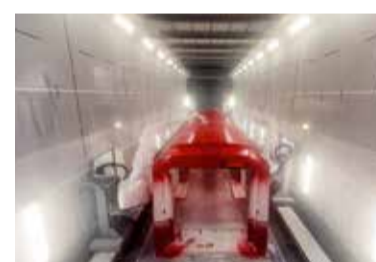
Der Roboter lackiert einen G1.

Wagenkasten in die Montagehalle, das Herzstück der Fertigung. Hier wird der Fahrzeugkopf mit dem Wagenkasten verklebt. Immer ein besonderer Akt: Erstmals bekommt der Zug sein typisches Aussehen. Die Bahnen werden dann isoliert und gedämmt, der Fußboden wird in den Wagenkasten eingelegt und der Fußbodenbelag verlegt und verklebt. Parallel werden die Kabelkanäle für die Elektrik vorgefertigt und vorbereitet. Beim G1 gibt es einen großen Kabelkanal im Untergestell und zwei kleinere Kabelkanäle in der Innendecke. Die Arbeiten kon-