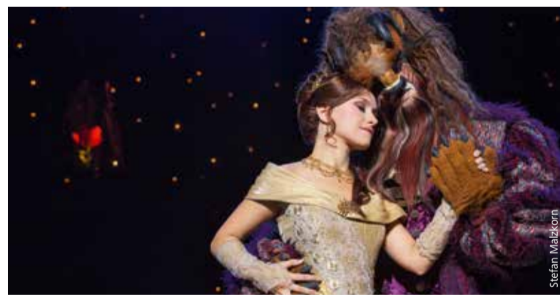
Das Musical „Die Schöne und das Biest“ fasziniert noch immer.

und-das-biest-musical.de. Die Eintrittskarten ermöglichen die kostenfreie Hin- und Rückfahrt mit den öffentlichen Verkehrsmitteln im gesamten VGN-Gebiet. Da das KombiTicket bereits ab vier Stunden vor Veranstaltungsbeginn gilt, ist eine entspannte Anreise garantiert. Zur Frankenhalle kommen Besucher bequem mit der U-Bahn-Linie 1, Haltestelle Messe. ■