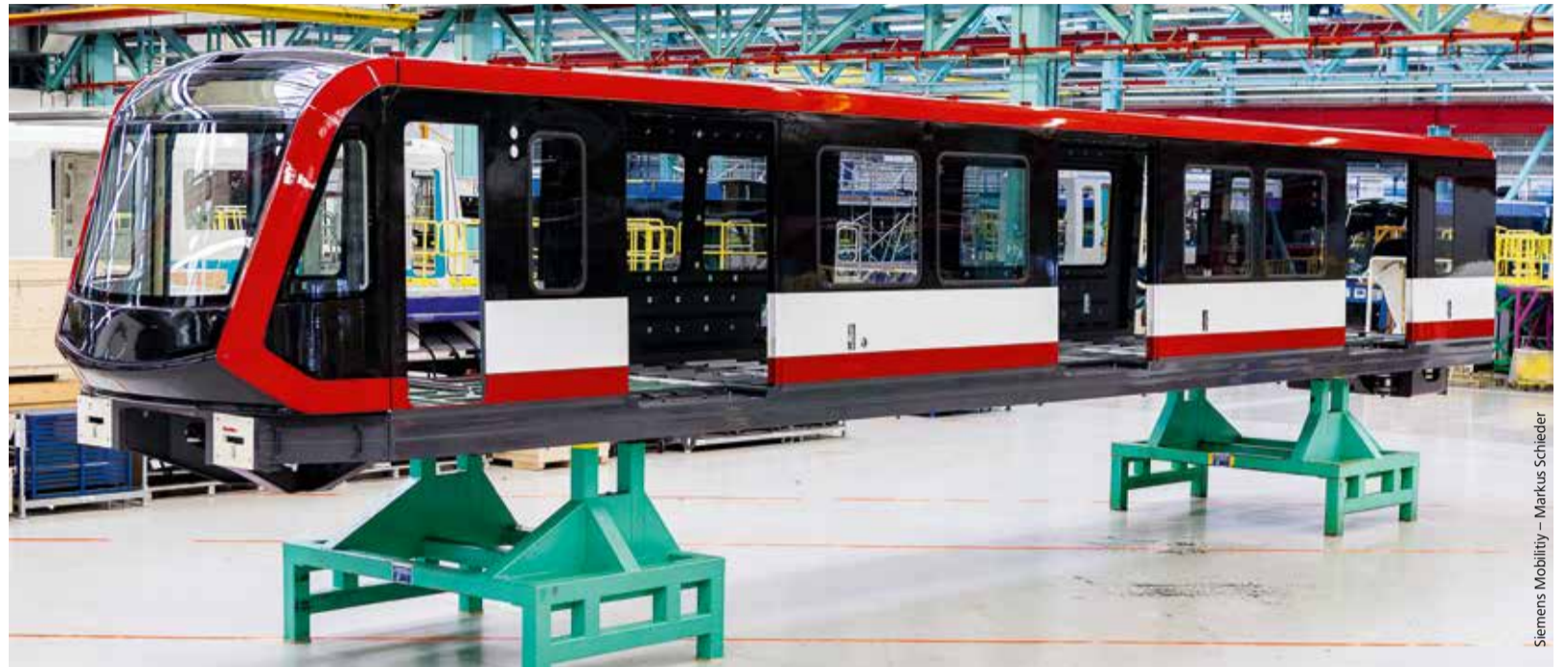
Modern und dynamisch: einer von vier Teilen. Der Kopfwagen gibt einen Eindruck von Nürnbergs erstem vierteiligem Gliederzug, kurz G1 genannt.

Die Tage bis zur Auslieferung des ersten Fahrzeugs seien inzwischen überschaubar. Im ersten Quartal 2019 sei es so weit, so VAG-Gesamtprojektleiter Bernd Meier-Alt, bei dem alle Fäden zusammenlaufen. Er und das Team um ihn herum müssen die Übersicht behalten und an jedes noch so kleine Detail denken. Sie sind regelmäßig vor Ort in Wien, wo die U-Bahnen produziert werden, um sich mit dem Siemens-Projektteam abzusprechen, Entscheidungen zu treffen und die Produktion zu begleiten. „Bei solch langjährigen Projekten ist eine laufende Abstimmung und Nachjustierung während der Konstruktion und des Baus der Fahrzeuge unumgänglich. Manchmal ändern sich