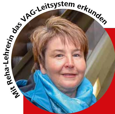
Mit Ratha-Lehrerin das VAG-Leitsystem erkunden