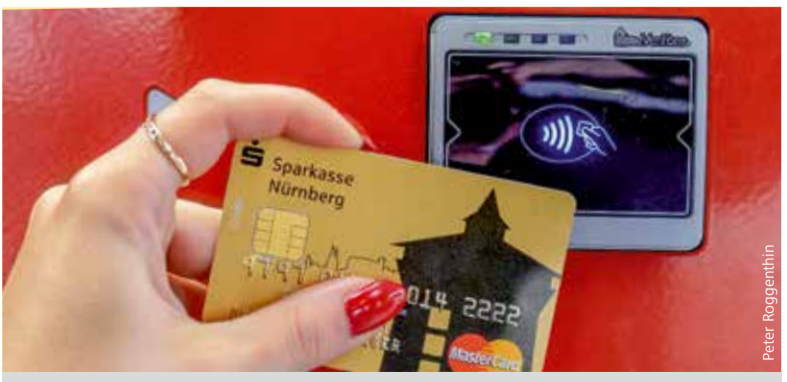
Das neue Kontaktlos-Lesegerät ist am Wellensymbol zu erkennen.