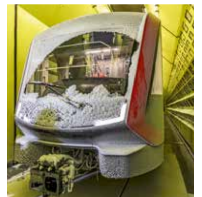
Freie Sicht trotz Schnee und Eis?