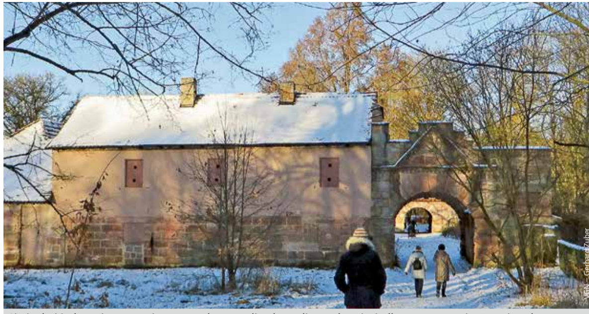
Sie ist bei jeder Witterung einen Besuch wert: die ehemalige Industriesiedlung Hammer im Pegnitztal.

Dort locken ein Gasthof und die Reste eines einstigen Herrensitzes,