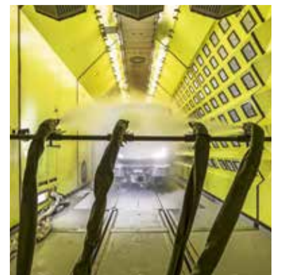
Wasser aus Düsen bringt Schnee.