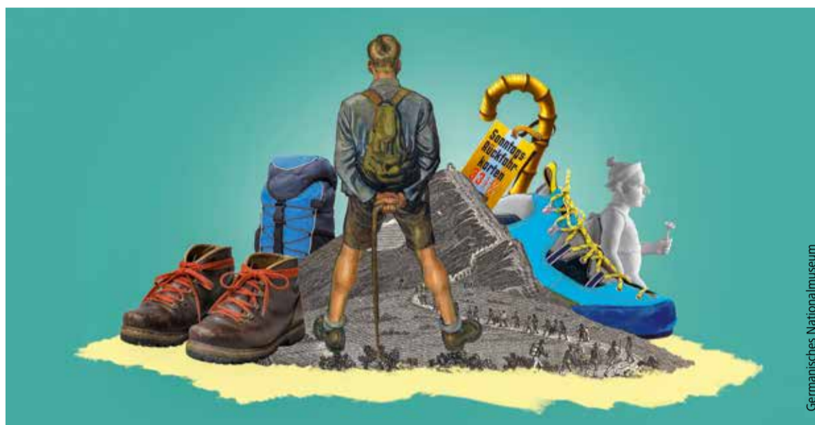
„Ist Wandern typisch deutsch?“ Dieser Frage geht eine Ausstellung im Germanischen Nationalmuseum nach.

Das Germanische Nationalmuseum zeigt mehrere Sonderausstellungen: Bis 6. Januar 2019 können luxuriöse Seidenkleider aus dem 18. Jahrhundert bewundert werden. Bis 20. Januar zeigt das Museum Möbel des Jugendstil-Designers Richard Riemerschmid. Bis 27. Januar sind in „Warenzauber“ alte deutsche Werbeplakate zu sehen. Und bis 24. April widmet sich die Ausstellung „Wanderland“ der Frage: „Ist Wandern typisch deutsch?“ Hinzu kommen die noch länger laufenden Sonderausstellungen zu Franz Marc und zu Architekturbüchern. Eintritt acht Euro, ermäßigt fünf Euro.