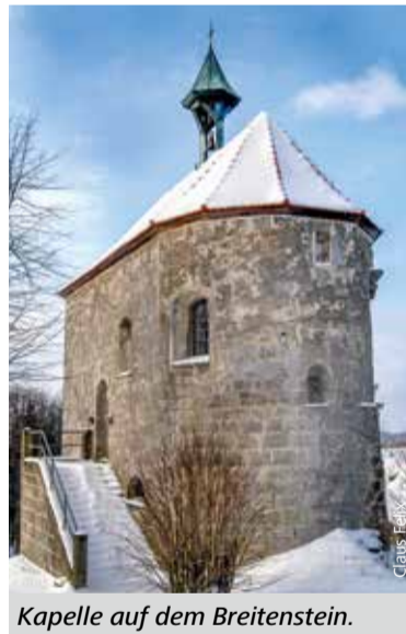
Kapelle auf dem Breitenstein.