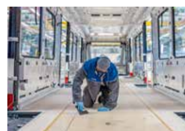
Der Boden wird gespachtelt.