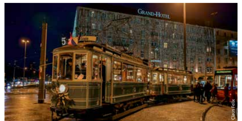
Alle Jahre wieder schön: die Glühweinfahrten an Adventswochenenden.

Fahrzeuge wiederaufgebaut und restauriert werden können. Im Fahrpreis von 34,00 Euro ist neben Glühwein oder Kinderpunsch in der Sammeltasse und Lebkuchen ein Spendenbaustein in Höhe von 15,00 Euro für das aktuelle Projekt der Straßenbahnfreunde enthalten, den Wiederaufbau des Beiwagens 1023. Ein Jahr lang wurde er von den Verkehrsbetrieben in Nürnbergs Partnerstadt Krakau aufgearbeitet und ist gerade ins Straßenbahndepot zurückgekehrt. Detailliertere Informationen zu dem Restaurierungsprojekt bekommen Fahrgäste unterwegs aus erster Hand. Anmeldung unter vag.de/gluehweinfahrten oder telefonisch unter 0911 283-46 46. Und wenn es 2018 nicht klappt, für Weihnachten 2019 vormerken. ■